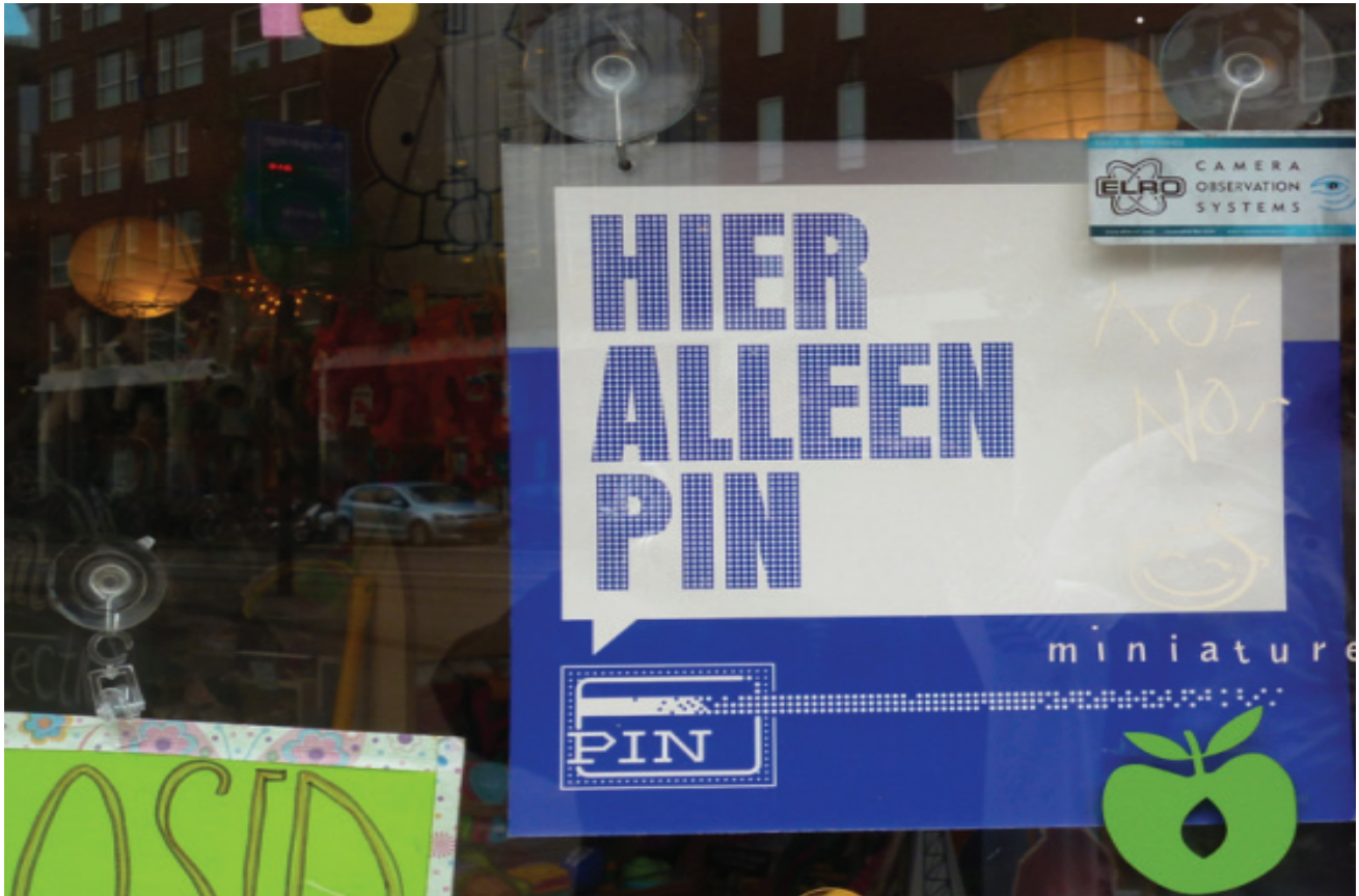
NO CASH HERE

The Dutch are the least likely of all eurozone Europeans to use cash, according to a new report by the European central bank on the use of cash by households in the euro area.