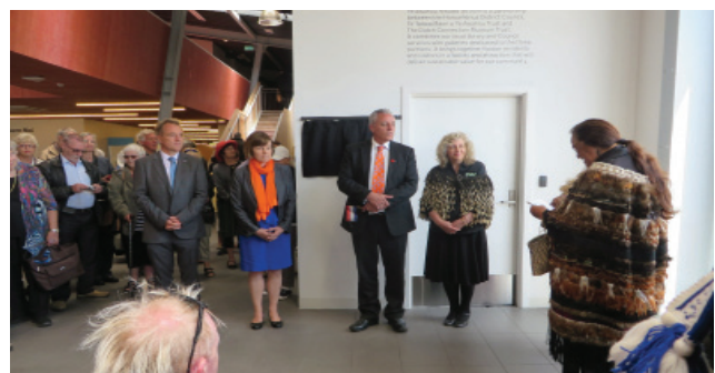
The official unveiling of a plaque of Te Awahou Nieuwe Stroom Museum on 18 November 2017 in Foxton

Oops: A framed drawing of planes dropping food parcels over Rotterdam in 1945, donated by Echo Radio, was also on display, although a slight error was made who had donated the print.