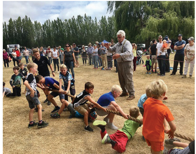
Here we're playing tug of war were the girls outdid the boys by far!