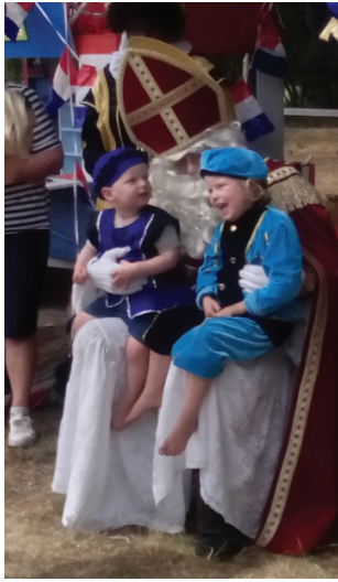
On Sinterklaas' knee: young and old love to be