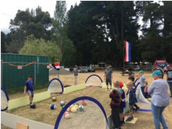
Don't be a fool Go and play Marcel's Footpool